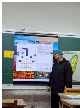
說明： 基本戰術---捉雙得子