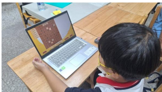
說明： 電腦連將殺練習