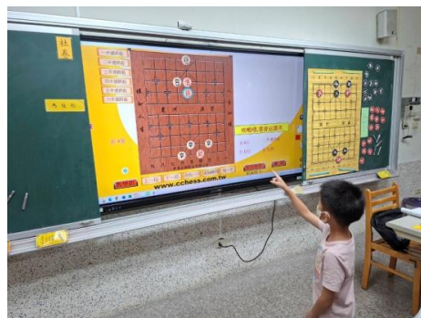
說明： 電腦連將殺練習