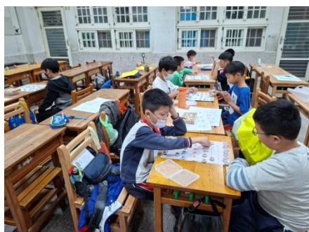
說明： 實戰自由對弈練習