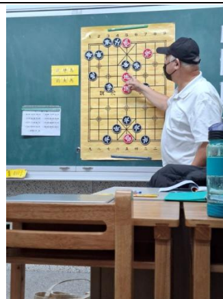
說明： 趣味殘局-借馬使炮